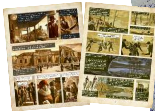
Confrontation au Tribunal