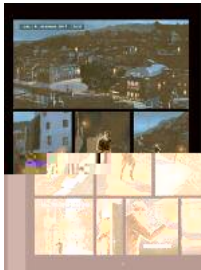
11 décembre 1947, à la nuit Louis Chavance découvre le théâtre des événements...

Réglé la somme de : ..... maiade La nouaille - 19160 Lamazière-Basse 05 55 95 88 31